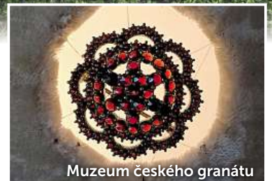
Muzeum českého granátu

Tip na závěr: Zastavte se na Švestkové dráze v obci Sulejovice! Nově otevřené Muzeum cihel vás překvapí unikátní sbírkou pozoruhodných kousků tohoto tradičního stavebního materiálu.