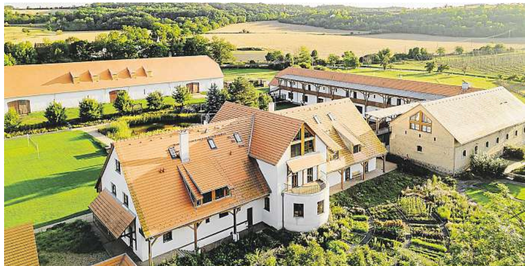
DVŮR PERLOVÁ VODA V MALEBNÉ KRAJINĚ ČESKÉHO STŘEDOHOŘÍ NAJDOU LIDÉ MÍSTO, KTERÉ NABÍZÍ ODPOČINEK, WELLNESS, ALE I SKVĚLOU KUCHYNI A VÝBORNÉ PIVO.