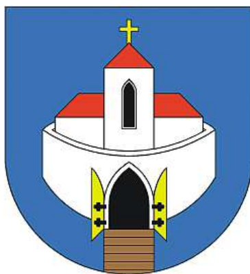
STAROSTA ROMAN BRAND

Tohle je téma, jemuž se dlouhodobě věnujeme. Investice do školství považuji za jednu z nejdůležitějších oblastí. Počet mladých rodin ve Spořicích roste, proto jsme kapacity školských zařízení postupně navyšovali. Nyní se nám daří poptávku pokrývat, ale víme, že musíme myslet dopředu. Chceme, aby děti měly kvalitní prostředí a aby rodiče nemuseli řešit, zda jejich dítě bude mít místo ve školce či škole. Škola i školka pro nás nejsou jen budovy, ale důležitá součást života místních.