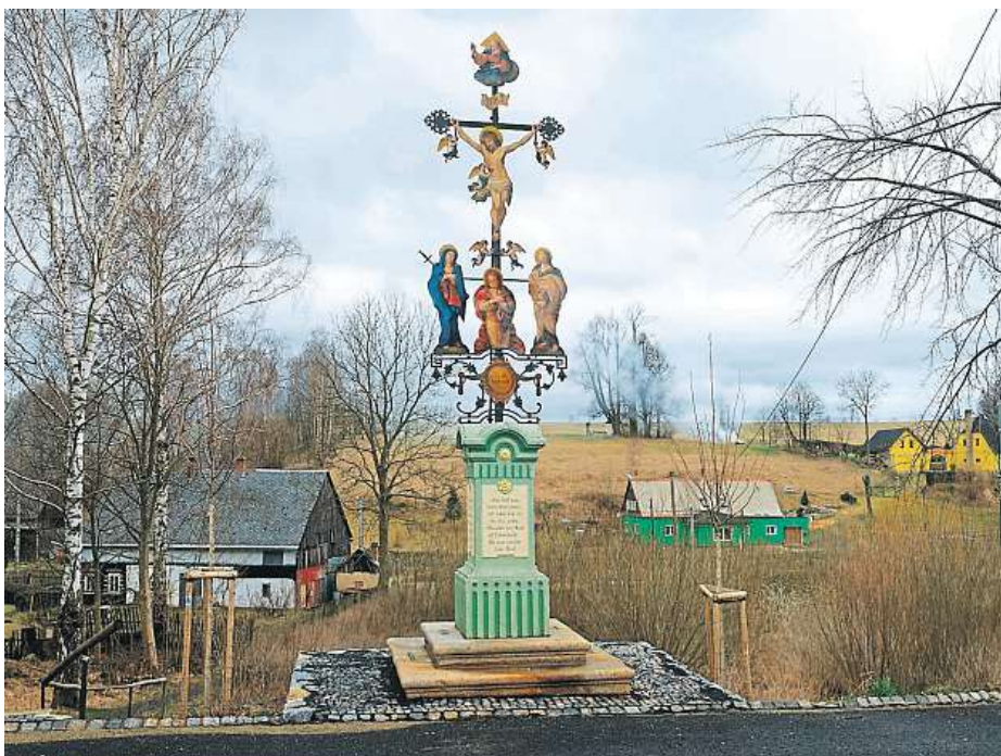
DVĚ ZASTAVENÍ SOUČÁSTÍ NAUČNÉ STEZKY JE KAPLE BIČOVÁNÍ KRISTA POD JEDNOU Z KŘÍŽOVÝCH CEST VE ŠLUKNOVĚ ČI VOGELŮV KŘÍŽ V MÍSTNÍ ČÁSTI KRÁLOVSTVÍ.

Představují přírodní, ale i kulturněhistorické zajímavosti. Jde o ucelenou síť tzv. Šluknovských stezek, na jejichž konceptu město pracovalo od roku 2021. Jmenují se Architektura, Lomy, Fukov – stezka po zaniklé vesnici a Velký vyhlídkový okruh. Vedou po zajímavých stavbách ve