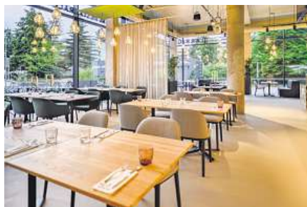
Restaurace ARRIGŮ v Děčíně

Na uznávané gastromapě je od roku 2025 také Restaurace ARRIGO v Děčíně. Získala prestižní doporučení v MICHELIN Guide pro rok 2025. Toto ocenění potvrzuje vysokou úroveň moderní gastronomie. Podnik klade důraz na lokální suroviny, sezónnost a kvalitu. ARRIGO se tak stalo jedním