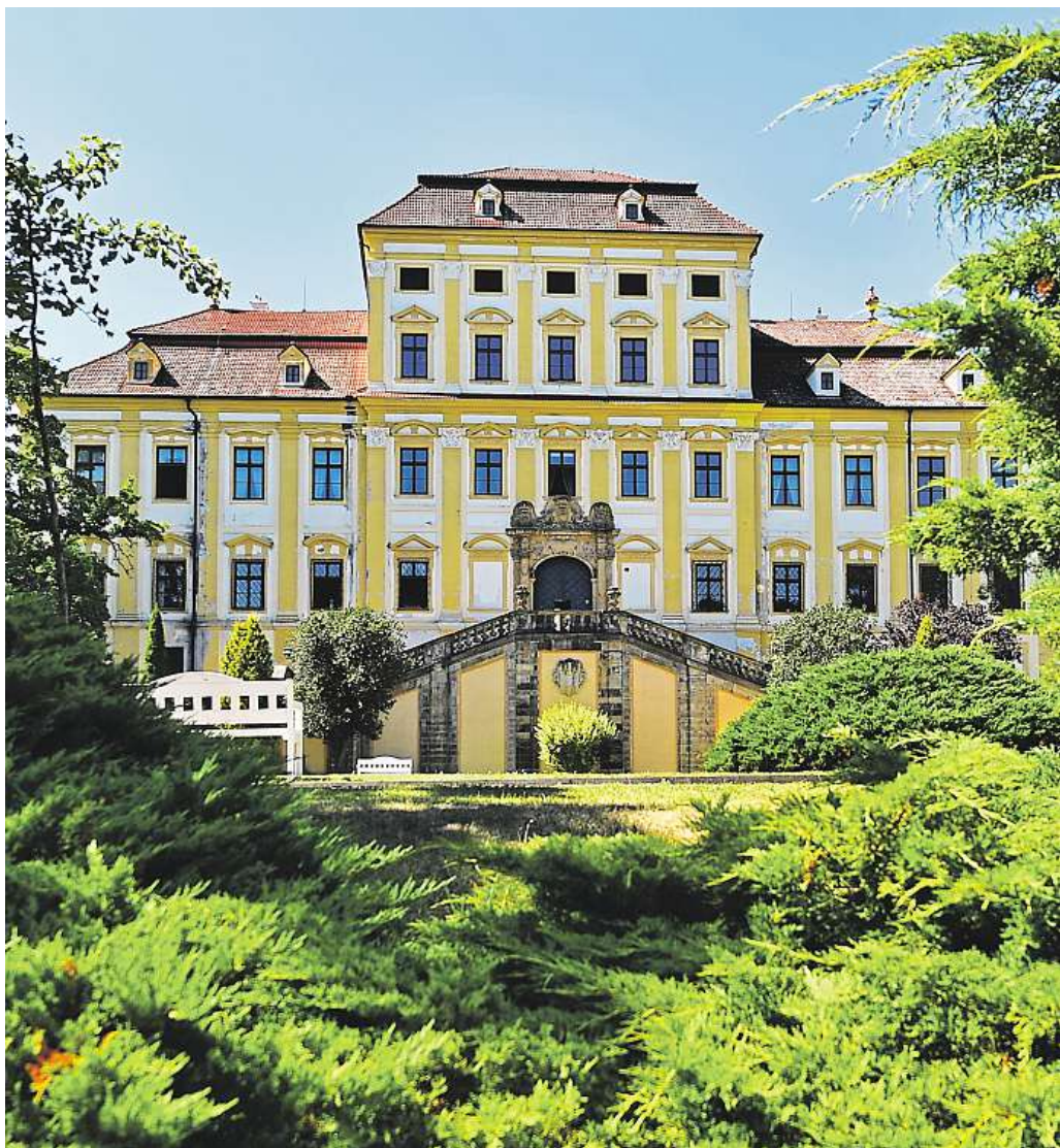
ČERVENÝ HRÁDEK U JIRKOVA SVÉ JMÉNO ZÍSKAL BĚHEM HUSITSKÝCH VÁLEK, KDY HO TEHDEJŠÍ MAJITEL NECHAL NATŘÍT NA ČERVENO.

Výšlap má 17 kilometrů, nastoupáte 320 metrů a klesání činí 380 metrů.