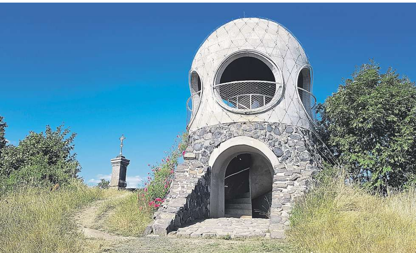
RŮŽENKA NA PASTEVNÍM VRCHU VEŘEJNOSTI SE 6,2 METRU VYSOKÁ ROZHLEDNA OTEVŘELA V ROCE 2018. ZAJÍMAVOSTÍ JE, ŽE POVRCH VYHLÍDKOVÉ VĚŽE POKRÝVÁ NEREZOVÁ SÍŤ, KTERÁ MÁ SLOUŽIT JAKO OPORA PRO POPÍNAVÉ ROSTLINY.

Přinášíme tipy na rozhledny, při jejichž návštěvě se vám zatají dech. Máme pro vás i jedno NEJ.