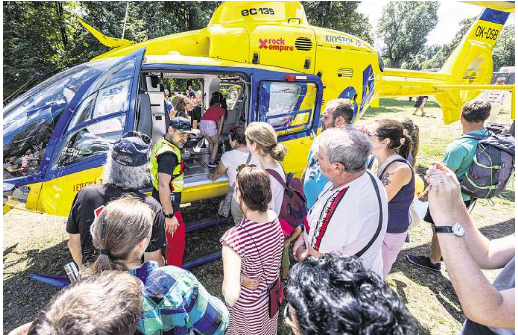
Návštěvníci si budou moci na letišti prohlédnout i Barču, královnu ústeckého nebe

Návštěvníci se mohou těšit na pestrý program plný techniky, dynamických ukázek i osobních setkání s profesionály z jednotlivých složek. Na letištní ploše budou k vidění moderní zásahová vozidla, vybavení jednotlivých složek, vrtulník či hasičský žebřík. Chybět nebude ani ukázka slaňování. Návštěvníci se mohou těšit na realistické ukázky zásahů – například práce hasičů u dopravní nehody, policejní zákroky nebo zásah záchranářů při mimořádných událostech. Den IZS s Armádou ČR však není jen o technice a akci. Návštěvníci budou mít možnost poznat práci bezpečnostních a záchranných složek zblízka,