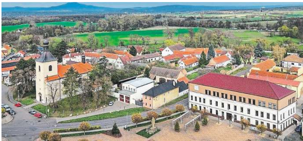
KAMILA ČVANČAROVÁ JE STAROSTKOU MĚSTA BOHUŠOVICE NAD OHŘÍ NA LITOMĚŘICKU, V NĚMŽ ŽIJE PŘÍBLIŽNĚ 2 400 OBYVATEL.

Co byste doporučila lidem, kteří chtějí v létě vyrazit po Bohušovicích nad Ohří a okolí?