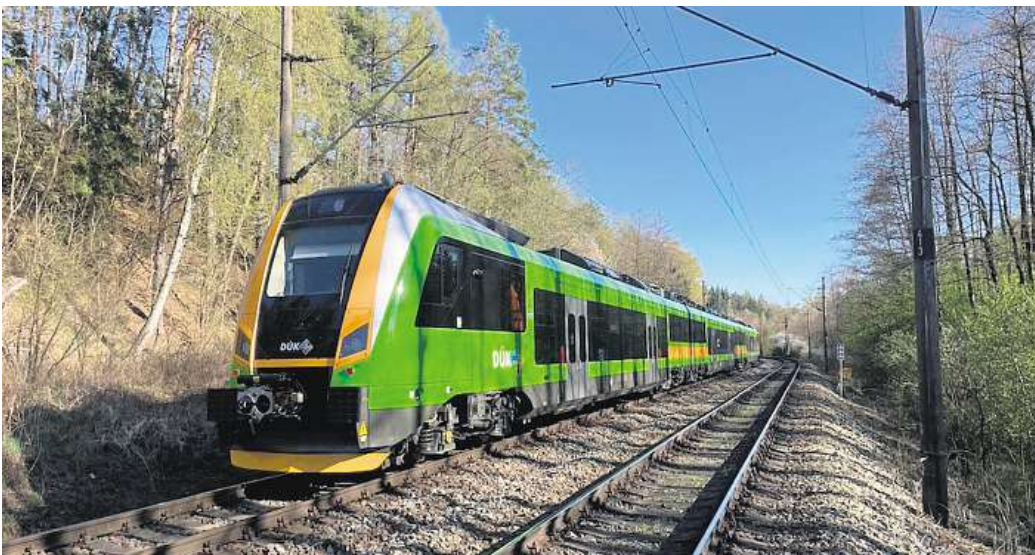
Nové zelené vlaky postupně nahradí starší soupravy